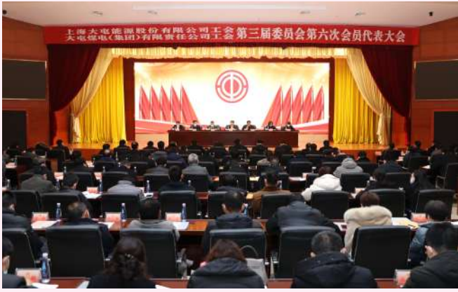
公司召开职工代表大会暨工作会议