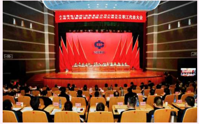
公司工会三届六次会员代表大会召开