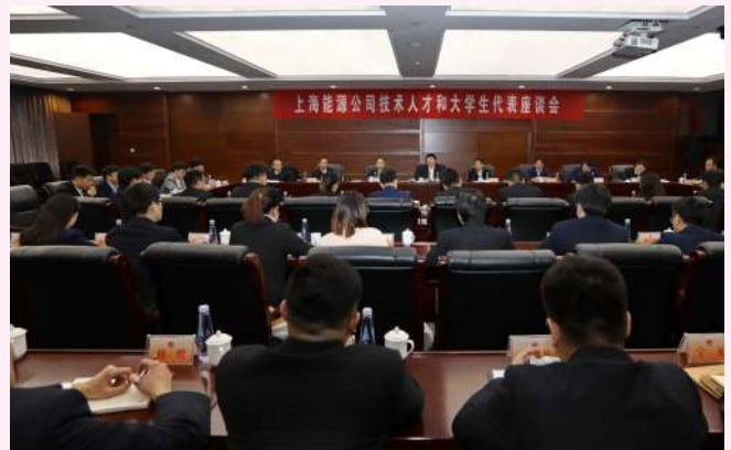
公司召开职工代表大会暨工作会议