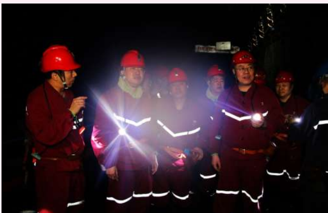
包正明元旦期间深入基层慰问干部职工