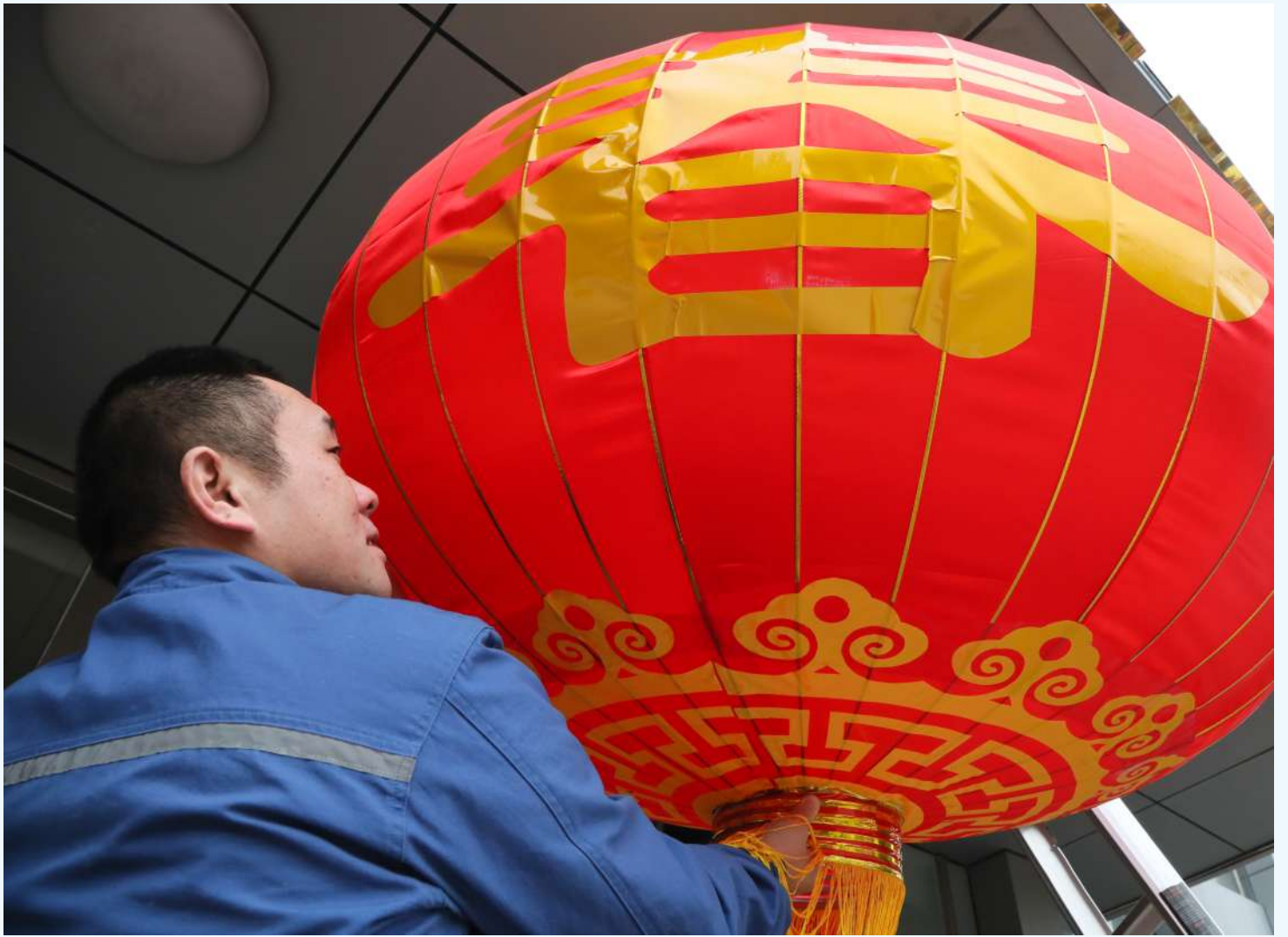
欢度春节