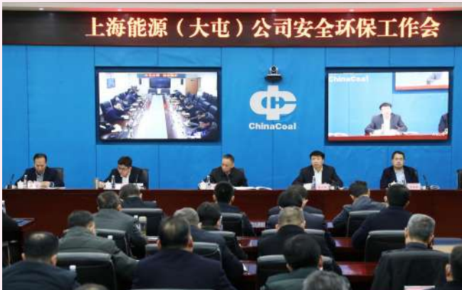
公司召开安全环保工作会