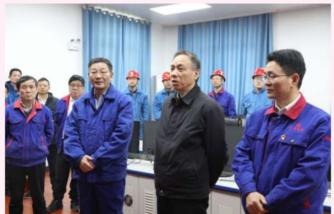
毛中华元旦期间深入基层慰问干部职工