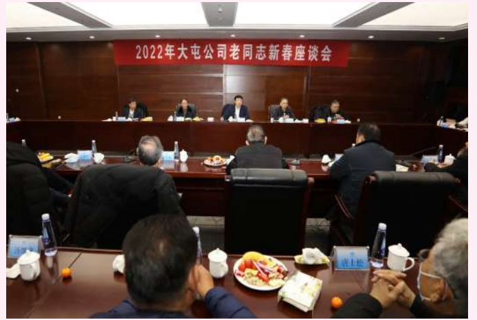
公司召开2022年老同志新春座谈会