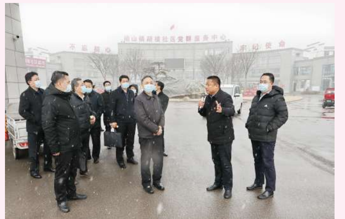
公司组织党员干部赴沛县泗山镇胡楼村学习胡楼精神