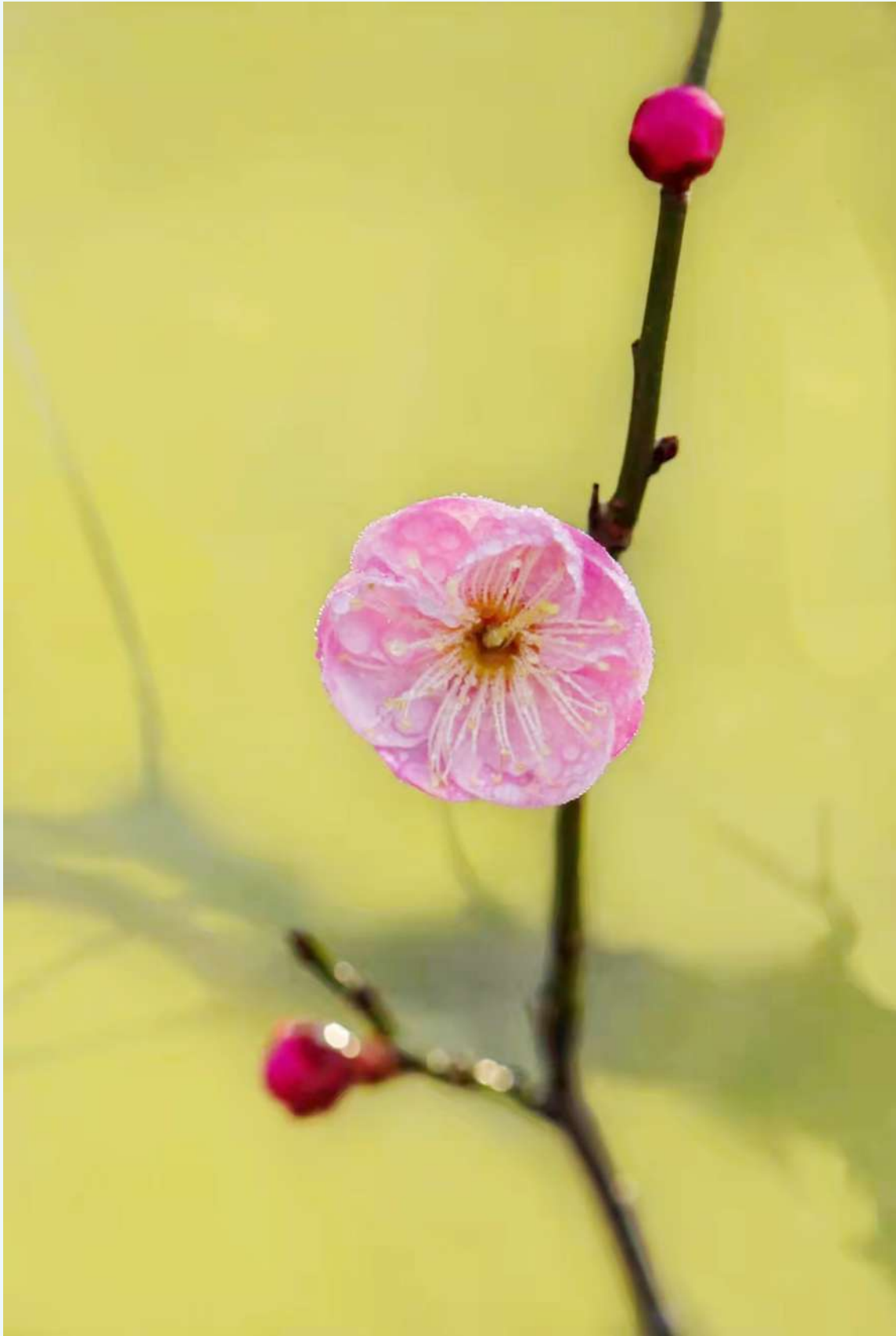
红梅报春