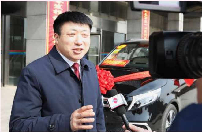
公司获得2021年度沛县财政贡献十强企业等多项荣誉