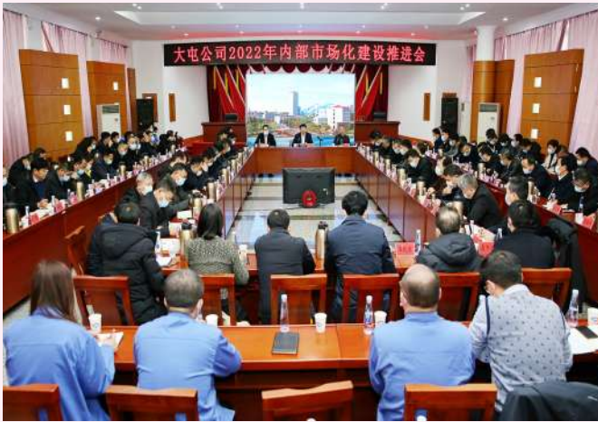
公司召开2022年内部市场化建设推进会